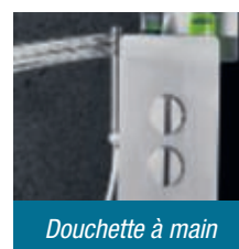
Douchette à main