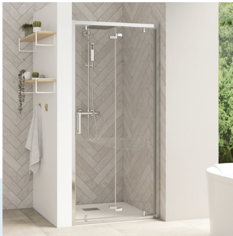
Smart Design S - profilé chromé