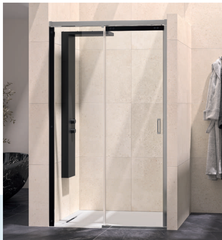
Flat C - partie fixe à gauche