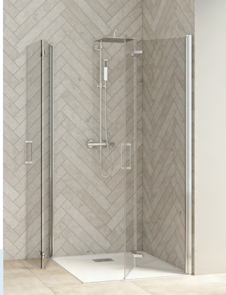
Smart Design A/S sans seuil - profilé chromé